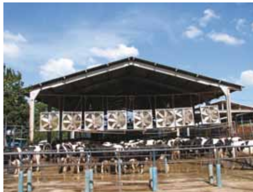
SALA DE ORDENHA COM PÉ DIREITO ALTO