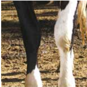
Escore 1. Sem alterações.

Monitore o conforto das vacas em lactação utilizando o escore de lesões apresentado nas figuras abaixo: