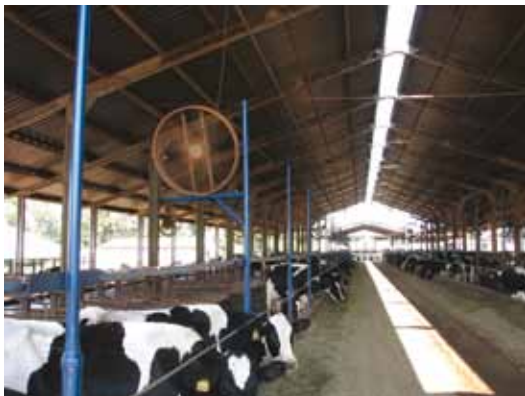
GALPÃO COM PRESENÇA DE LANTERNIM

Ventilação natural: Utilize de forma eficiente a ventilação natural do ambiente, tendo em conta os ventos predominantes no planejamento da instalação. Salas de ordenha e galpões devem ter o pé direito alto (pelo menos 3 m nas laterais) e lanternins (que são aberturas na cumeeira, que é a parte mais alta do telhado, como exemplificado na figura abaixo e à esquerda), que permitem a saída de ar quente localizado no cume do telhado do galpão. Escolha um local fresco da propriedade, que facilite a formação de corredores de vento, longe de barrancos ou encostas.