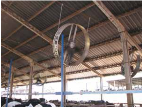
SISTEMA DE VENTILAÇÃO NO FREE-STALL

Ventilação artificial: É feita com uso de ventiladores instalados em locais estratégicos das salas de espera, de ordenha e nos estábulos. Para que a ventilação seja eficiente, não ocupe completamente todo o local, trabalhe de forma que pelo menos metade da área da sala de espera fique livre, assim a circulação do ar será mais eficiente e também facilitará a movimentação dos animais.