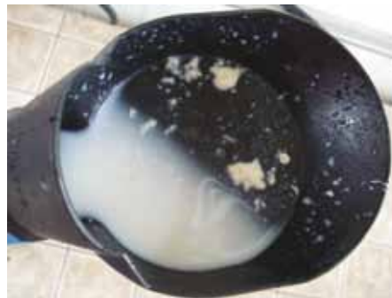
LEITE DE VACA COM MASTITE APRESENTANDO GRUMOS

Para maiores informações sobre o diagnóstico da mastite consulte o “Manual de Boas Práticas de Manejo – Ordenha”, disponível em www.grupoetco.org.br .