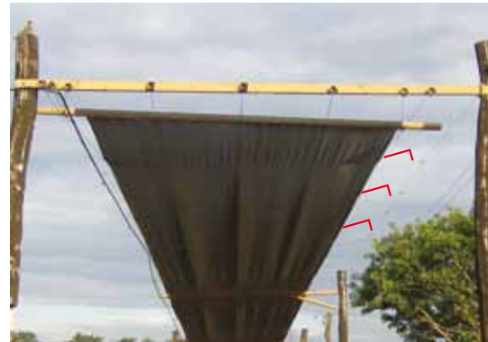
TELA DE SOMBREAMENTO ADEQUADAMENTE FIXADA