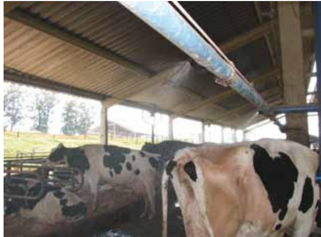
ASPERSOR PARA VACAS MANTIDAS EM FREE-STALL

Aspersão: neste sistema são liberadas gotas maiores, que umedecem o corpo do animal (figura ao lado), a perda de calor ocorre pelo processo de evaporação da água que está sobre o corpo do animal. Este tipo de sistema é mais eficiente quando combinado com o uso da ventilação forçada para acelerar o processo de evaporação. Há ainda sistemas que adotam a aspersão de água no telhado das salas de espera e de ordenha, reduzindo a temperatura do ar dentro destes ambientes.