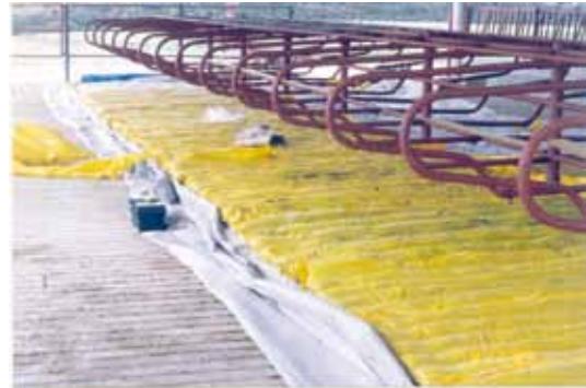
COLCHÕES SENDO COLOCADOS NO FREE-STALL. POSTERIORMENTE SERÃO REVESTIDOS COM LONA