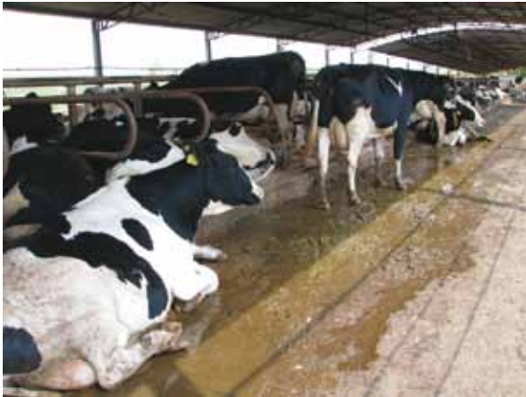
VACAS DEITADAS NOS CORREDORES DO FREE-STALL SÃO INDÍCIOS DE PROBLEMAS