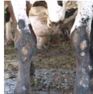
Escore 3. Ausência de pelo, edema e escoriações.