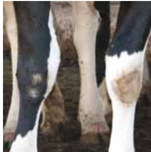
Escore 2. Ausência de pelos.