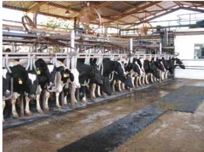
SALA DE ORDENHA COM PARTE DO PISO COBERTA POR TAPETE DE BORRACHA

Os tapetes de borracha podem ser fixados apenas nos locais de maior risco de escorregões e quedas, bem como em outras áreas onde as vacas passam muito tempo, como a sala de ordenha. Estes reduzem a abrasão e a pressão nos cascos, oferecendo mais conforto para as vacas. Por outro lado, os tapetes de borracha aumentam os custos com as instalações e exigem maior manutenção, quando comparados aos pisos de concreto.