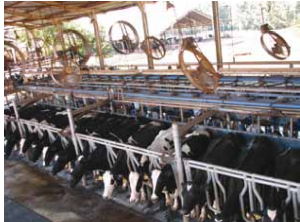
SALA DE ORDENHA COM SISTEMA DE VENTILAÇÃO