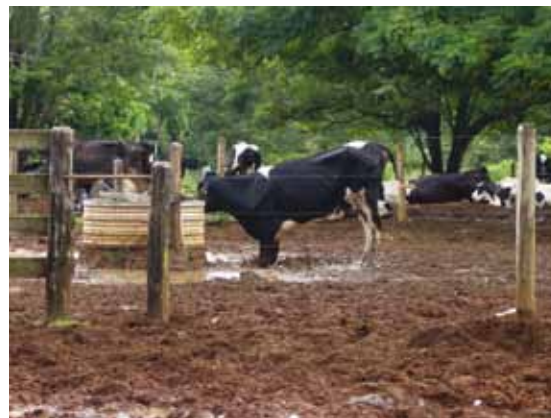
A FORMAÇÃO DE LAMA, COMUM DURANTE A ESTAÇÃO CHUVOSA, COLOCA EM RISCO O CONFORTO DAS VACAS ALOJADAS EM PIQUETES