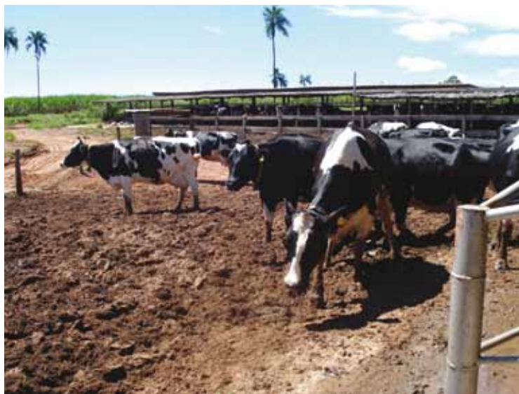
EVITE CAMINHOS COM PEDRAS E FORMAÇÃO DE LAMA, QUE DIFICULTAM A PASSAGEM DOS ANIMAIS