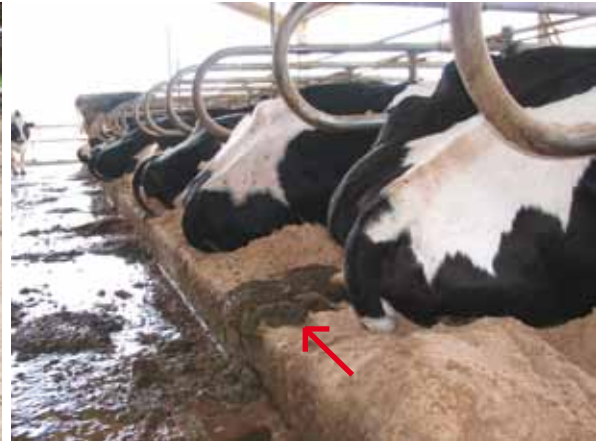
O IDEAL É QUE AS FEZES CAIAM NO CORREDOS E NÃO SOBRE A CAMA

3. Material da cama: As vacas preferem deitar em superfícies macias e frescas. Todos os tipos de cama possuem algumas vantagens e desvantagens, sendo que alguns são mais desejáveis que outros pelos benefícios à saúde e ao bem-estar animal. Pensando no conforto da vaca a pior situação é a ausência de cama, com os animais deitando diretamente no concreto, que é duro e abrasivo, o que causa lesões e calos nas articulações dos joelhos. Nunca deixe de disponibilizar material de cama para todas as vacas alojadas e em quantidade suficiente, com altura média de 10 a 15 cm.