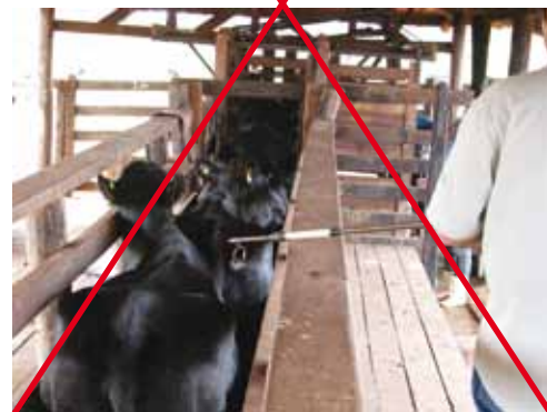
MANEJOS INADEQUADOS DURANTE A VACINAÇÃO