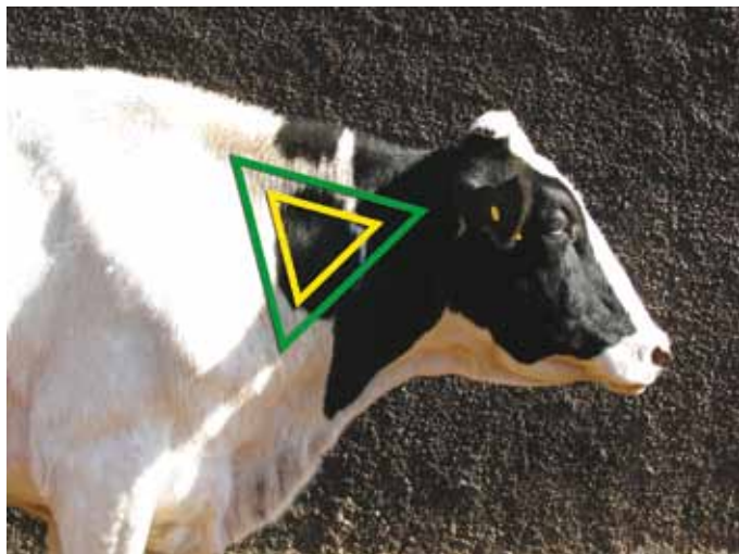
LOCAL CORRETO DA APLICAÇÃO SUBCUTÂNEA (TRIÂNGULO VERDE) E DA INTRAMUSCULAR (TRIÂNGULO AMARELO)

Independente da via de administração - subcutânea ou intramuscular - todas as vacinas devem ser injetadas no pescoço do animal. A área específica da injeção da vacina é apresentada na figura abaixo.