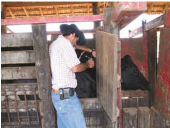
VACINAÇÃO REALIZADA NO TRONCO DE CONTENÇÃO

Quando a vacinação é realizada corretamente, o risco de ocorrência de doenças é reduzido, assegurando melhores condições de saúde e de bem-estar aos animais.