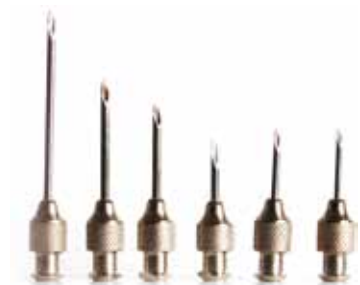
AGULHAS EM BOAS CONDIÇÕES

Adote procedimentos de segurança quando descartar agulhas e seringas; coloque-as em embalagens duras, como caixas e tubos, descartando o material embalado em um local apropriado e seguro.